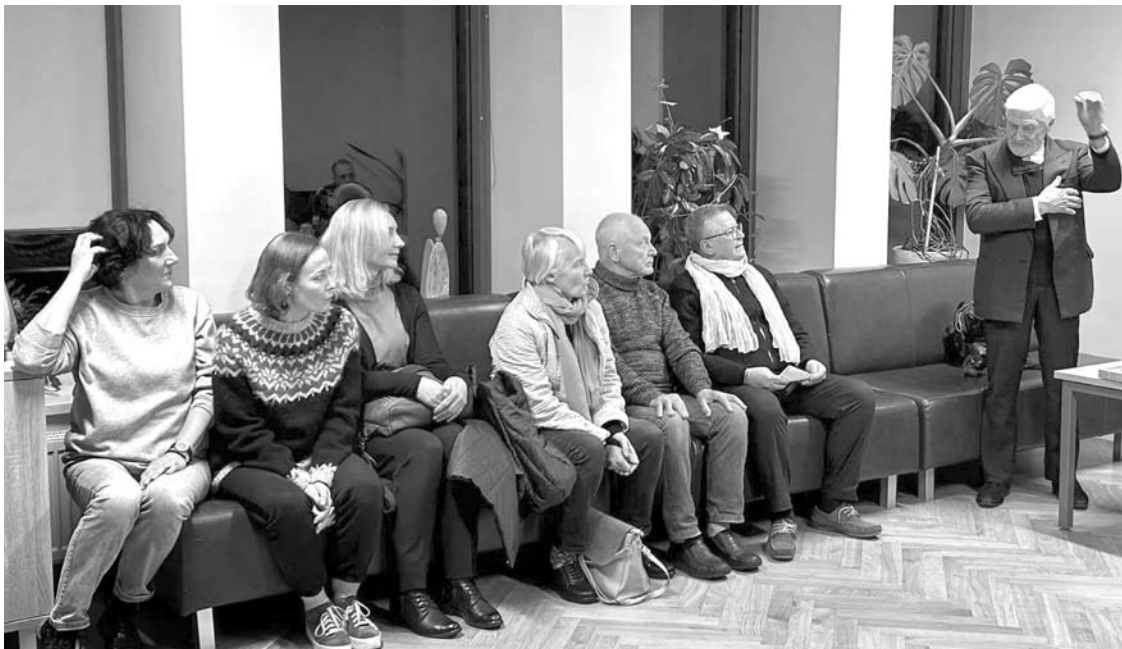
Režisierius Jonas Vaitkus po jo režisuoto spektaklio „Nebylys“ bendravo su Šiaulių dramos teatro aktorių komanda.

Baigėsi beveik dvi savaites Anykščių kultūros centre vykęs profesionalių teatrų nacionalinės dramaturgijos festivalis. Anykštėnams ir miesto svečiams per festivalį parodyti aštuoni spektakliai, o finaliniu reginiu buvo Šiaulių dramos teatro „Nebylys“. Šį spektaklį Anykščiuose stebėjo ir jo režisierius Jonas Vaitkus.