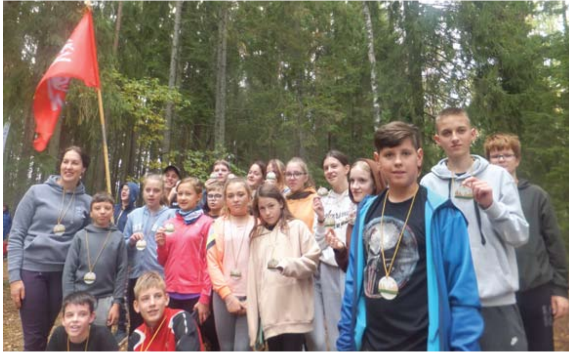
Gausiausia šiomet buvo Svėdasų Juozo Tumo-Vaižganto gimnazijos bėgikų komanda.

Oras buvo puikus, nuotaika nuostabi, dalyviai praleido laiką smagiai: sportavo, bendravo, istoriją pažino, šauliška koše stiprinosi, ežere maudėsi ir net grybavo.