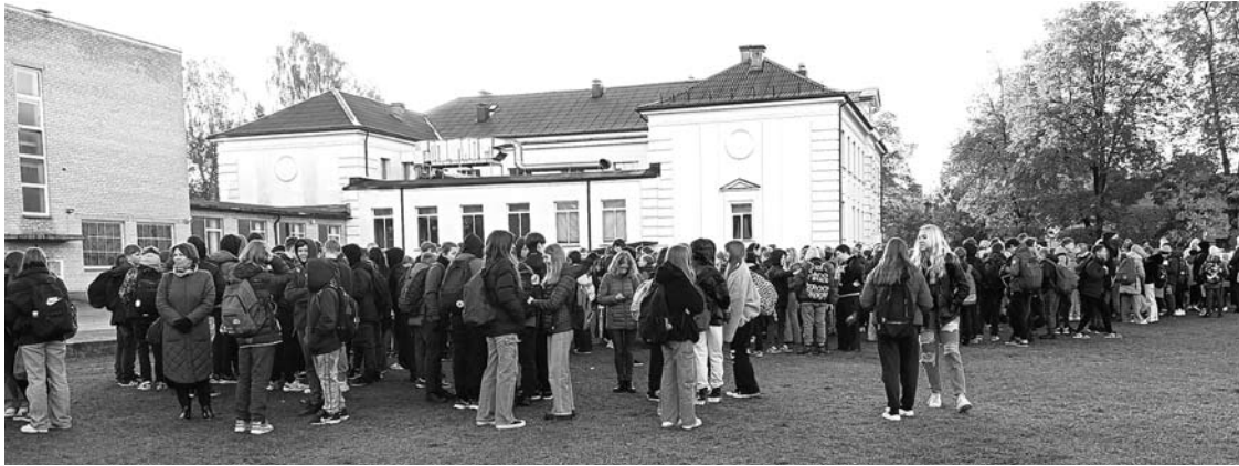
Anykščių Antano Vienuolio progimnazija grasinantį laišką gavo antrą kartą – praėjusį penktadienį mokykla taip pat buvo evakuota.

Ugdymo įstaigas apžiūrėję Anykščių rajono policijos pareigūnai leido darbą tęsti toliau.